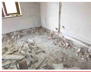
Durante i lavori