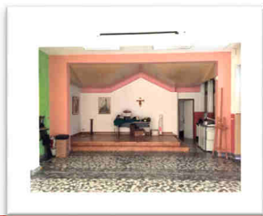
La sala prima