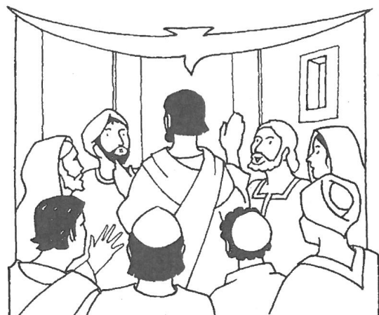
Mentre erano chiuse le porte del luogo dove si trovavano i discepoli per timore dei Giudei, venne Gesù, stette in mezzo a loro...

Per la comunione: quasi tutti hanno rispettato le indicazioni presentate. Ancora qualche raro caso che tenta di prendere la particola dalla mano del ministro. La particola non si prende con le dita, ma va poggiata sul palmo della mano.