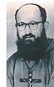
fra' Lazzaro Graziani

in memoria di fra' Graziani di Grumolo Pedemonte, nel 60° del martirio